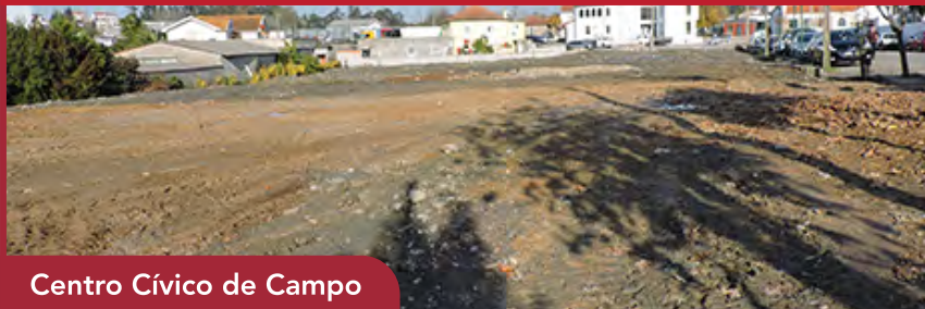
Centro Cívico de Campo