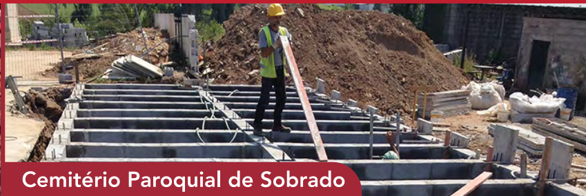
Cemitério Paroquial de Sobrado